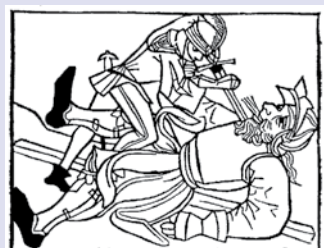
Heldentod auf Seite 3