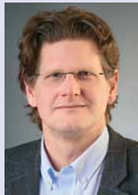
Hans Gerhard