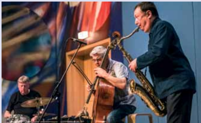
Butcher / de Joode / Blume, Foto ©: Heinrich Brinkmüller-Becker