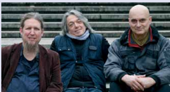
Rogers / Rupp / Schubert, Foto ©: Manuel Fenn